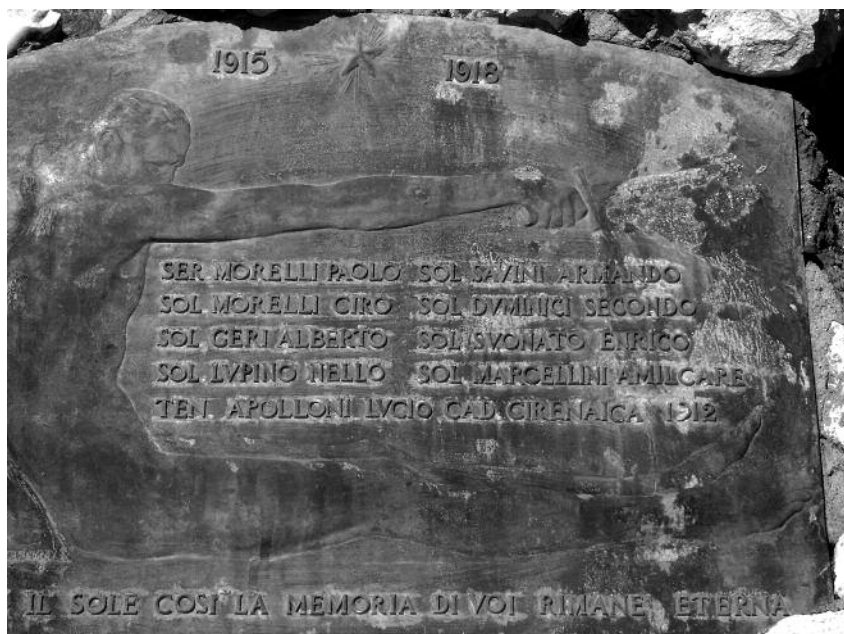
Lastra commemorativa in bronzo Caduti 1915-1918