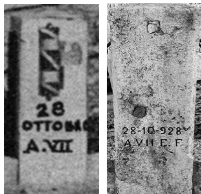
Cartolina del monumento (1930 circa) con colonnina con la data di erezione

gli angoli più sperduti dell'Europa del Nord a combattere a temperature proibitive. Molti di questi faranno ritorno a casa, molti altri invece moriranno sui campi di battaglia o risulteranno dispersi tra tanti altri corpi dilaniati e irriconoscibili. Il paese si appresta quindi a commemorarli con una targa in marmo da fissare sotto quella in bronzo della prima guerra mondiale, ma deve però affrontare le perentorie comunicazioni della presidenza del Consiglio dei Ministri che, attraverso la voce delle prefetture, intima ad ogni paese, Comune, cittadinanza che abbia un monumento in bronzo, di rimuoverlo dalle rispettive piazze e consegnarlo all'Endirot (Ente Distribuzione Rottami), incaricato tra gli anni 1941 e 1942 di rimuovere tutti i monumenti in bronzo italiani, indistintamente, per il recupero dei materiali da utilizzare per gli armamenti bellici. Nello stesso tempo la stessa presidenza del Consiglio dirama un'altra circolare datata 28 novembre 1942 con la quale invita i Comuni a fornire un bozzetto alla prefettura di altro analogo monumento ai Caduti da realizzarsi in marmo, in pietra o in cemento per sostituire quello rimosso. Alla rimozione dei monumenti in bronzo si aggiungono poi altre circolari che chiedono ulteriori sacrifici alle popolazioni con la rimozione e consegna