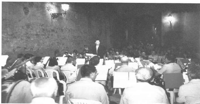
Agosto 2000 - 1 a edizione del "Concerto di mezza estate"

Sipicciano lo ha spinto a rendersi promotore di un'indimenticabile iniziativa il 22 novembre del 2005. E' la festa di Santa Cecilia e a Viterbo è presente l'Orchestra da Camera di Venezia diretta dal M o Riccardo Parravicini che si esibisce nella chiesa di Santa Maria della Verità. Il nostro maestro e compaesano riesce a portare a Sipicciano l'Orchestra che sotto la direzione dello stesso Maestro procura un'indescrivibile emozione ai presenti raccolti nella nostra chiesa parrocchiale, eseguendo la Sinfonia in Fa Maggiore opera n. 93 di Ludwig Van Beethoven, meglio conosciuta come 8 a Sinfonia.