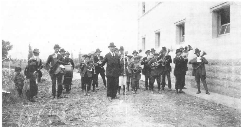
Anni '20 - Esibizione della Banda alla Tenuta di Castelvecchio

Sotto la direzione del perugino Flaminio Della Vicina, musicista di grande sensibilità, particolarmente attento agli aspetti tecnico-strumentali, la Banda di Sipicciano cresce musicalmente e si arricchisce di nuovi elementi che, gradualmente, vengono inseriti nel già affiatato ed importante complesso bandistico. Sono spesso ragazzi giovanissimi, senza esperienza, ma ricchi di volontà ed entusiasmo.