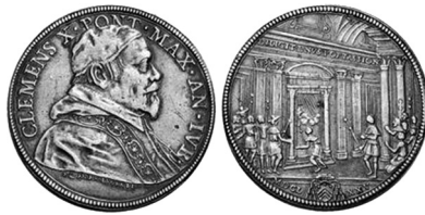
1675, Anno Santo, moneta d'argento con il busto di Clemente X e il portico della basilica di San Pietro

Morto papa Urbano nel luglio del 1644, Vincenzo Costaguti trova in papa Innocenzo X Pamphili un nuovo protettore che gli affida la legazione di Urbino, che mantiene dal 1648 al 1651 e alla quale riuscì a garantire un buon livello di condizione sociale, sebbene in quel periodo quasi tutta l'Italia fosse dilaniata dalla guerra e dalla carestia. In questo periodo restaurò la cattedrale di Pesaro, in seguito al quale i cittadini vollero dedicargli un monumento eretto nel 1649 accanto al Palazzo della Ragione.