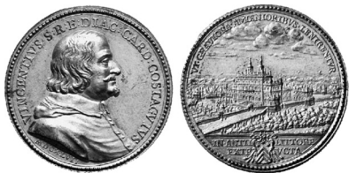
1647, moneta d'argento raffigurante il card. Vincenzo Costaguti e la villa "Bell'aspetto" ad Anzio