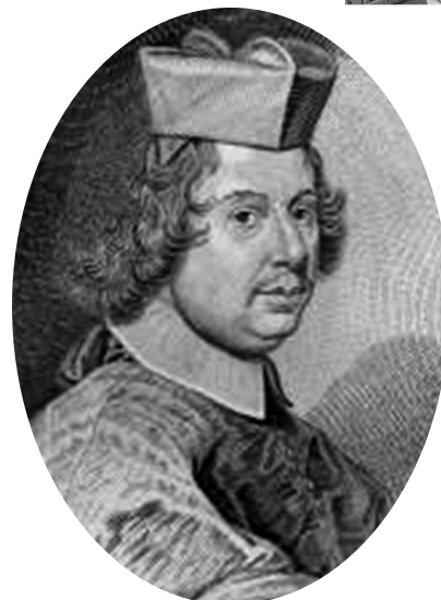
card. Giovan Battista Costaguti