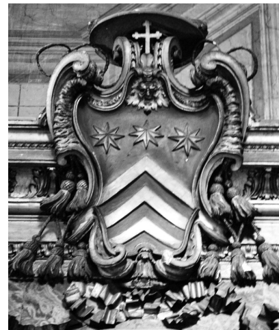
Roma, chiesa di S. Carlo ai Catinari, cappella Costaguti, stemma di famiglia